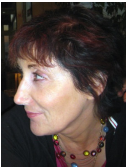
Chef/styrelseordförande, ADHD-AS-Dys Family Resources Bryssel