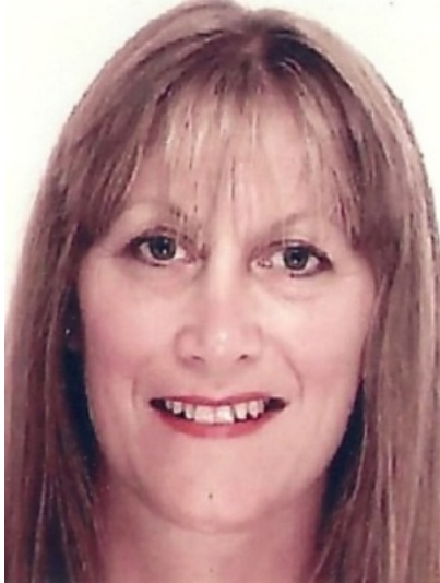
ADHD specialistsköterska, The Ryegate Children's Centre, Sheffield