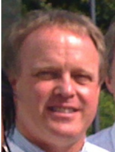
Forskningschef, Fondazione Attento