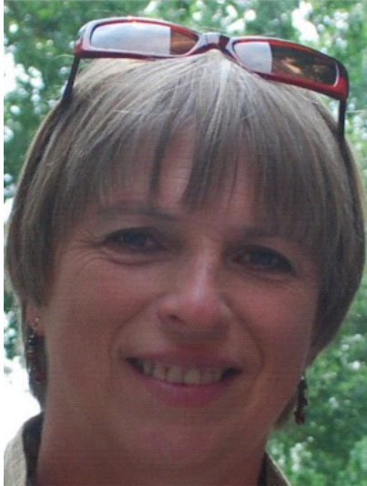
Samordnare, ADHD Europe