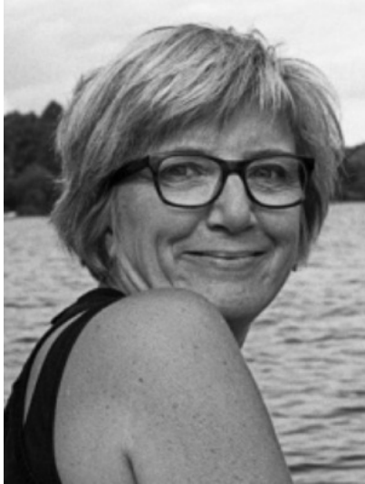
Chef, ADHD-förbundet, Danmark