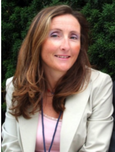
Konsulterande barn- och ungdomspsykiatriker