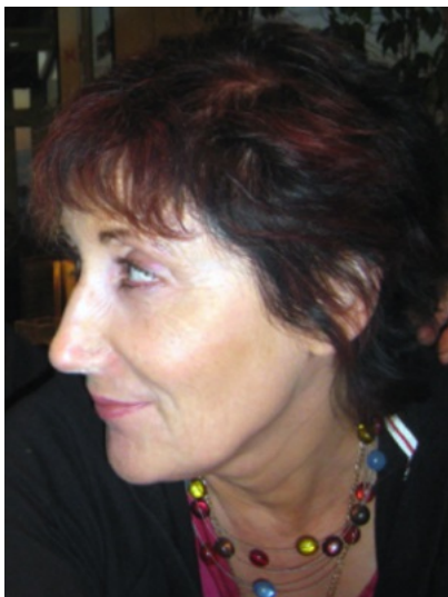
Chef/styrelseordförande, ADHD-AS-Dys Family Resources Bryssel