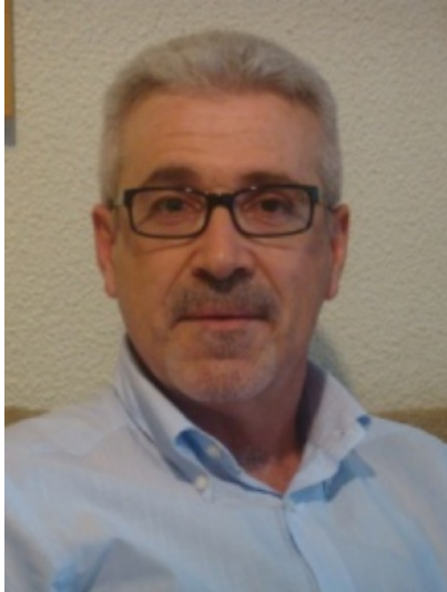
Murcia Social and Economic Council